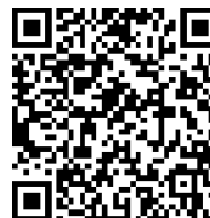
大樹生命岐阜駅前ビル