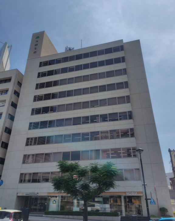
大樹生命広島駅前ビル